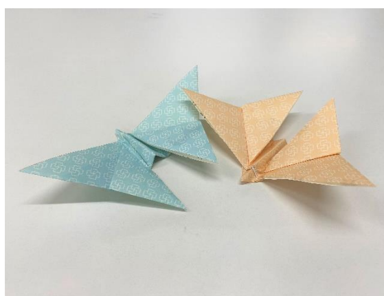
↑4月のイラストモチーフ「ちょうちょ」 をカレンダーの紙で作成しました