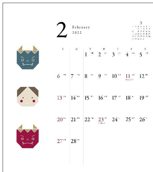
↑ 2月のカレンダー一面