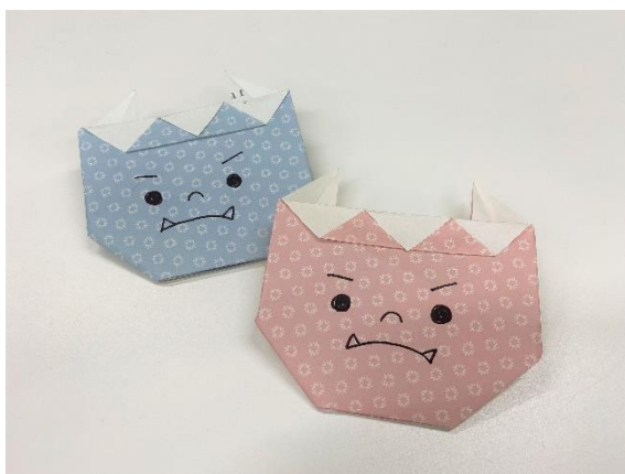
↑2月のイラストモチーフ「おに」を カレンダーの紙で作成しました

( https://www.origami-club.com/index.html ) 内より掲載しています。